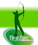
Tir à l'arc

Séances : - les vendredis scolaires, de 18 à 19h30 pour les jeunes de 12 à 18 ans et pour les adultes. Tout le matériel est prêté par l'association pour l'initiation (arc, flèches, protection avant bras et palette doigt). La cible passe progressivement de 9m à 18m, par palier de 3m. Passage au tir avec viseur après les fêtes de fin d'année.